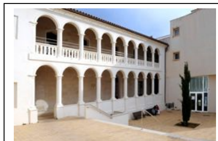
El Edificio Calabria reúne unas dependencias municipales y las sedes de Caritas, Proyecto Hombre y, ahora también, Pastoral Penitenciaria

Al equipo de Cáritas, más acostumbrado a torear con las administraciones, se le ocurrió la idea de implicar a los ayuntamientos (ocho en total) en nuestro proyecto. No cabe ninguna duda que para estos municipios el poder contar, en un momento determinado, con una reinserción acompañada y individualizada de sus conciudadanos afectados por estas circunstancias, es un beneficio. Por tanto se pensó en proponerles un porcentaje anual en relación al número de habitantes de cada uno. Algunos de ellos ya lo han hecho, otros no y otros están pendientes de formalizar esta contribución mediante un convenio. Para que os hagáis una idea la horquilla va desde: los dos municipios más grandes (unos 27.000 habitantes cada uno), que pagarían 2.400 € anuales hasta los más pequeños (unos 1.000), 600€ anuales. Con estas ayudas nivelaríamos la situación económica.