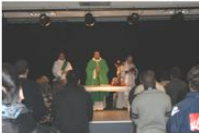
Delegación Diocesana de Pastoral Penitenciaria Solsona

Finalment el Sr. Bisbe s'acomiadà del Director i dels professionals del Centre que ens varen acompanyar durant tot el matí, agraint-los-hi la seva amable i cordial acollida.