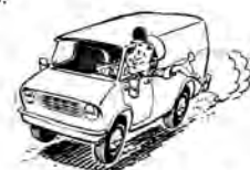
¡¡¡Todos en marcha!!!